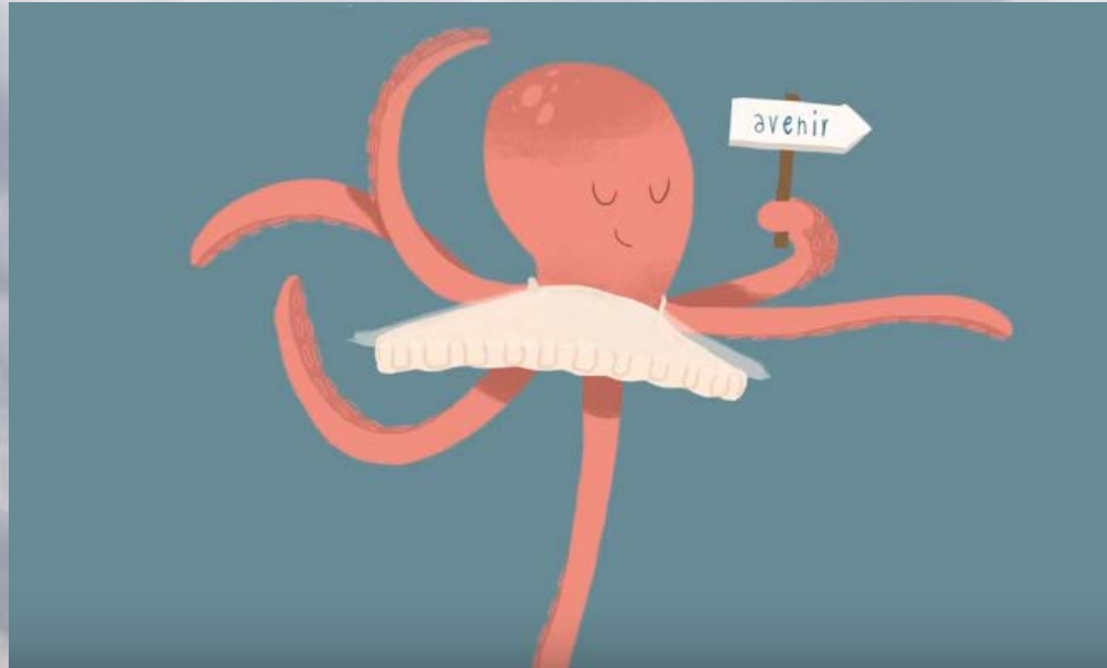
Image tirée de la vidéo « L'agilité en entreprise » idée originale Thierry Denys, coproduit par Agil'OA et Grenoble École de Management

UNIQUE COACHING LEADERSHIP • PLAISIR • RÉSULTATS